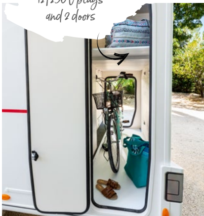
Beheizte, beleuchtete Stauräume mit Polyesterboden. Heated, lighted garage holds with GRP floor.