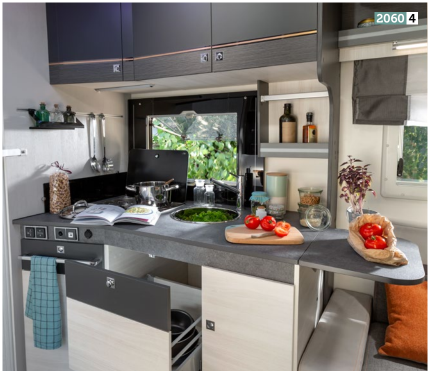
2 : XLB: Bett mit außergewöhnlichen Maßen: 200cm x 160cm. / XLB: bed with outstanding dimension: 200 x 160 cm thanks to an extra mattress. 3 : Maxi-Badezimmer mit sehr geräumiger Duschkabine + Kleiderschrank. / Maxi bathroom with a very spacious shower stall and wardrobe. 4 : Küche mit klappbarer Arbeitsfläche. / Kitchen with folding work surface.

Zum Absenken des Bettes brauchen die Kissen nicht abgenommen zu werden!